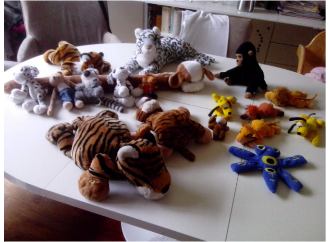
Materialen die nu verscheept worden. De verwachting is dat ze binnenkort aankomen in Gambia.