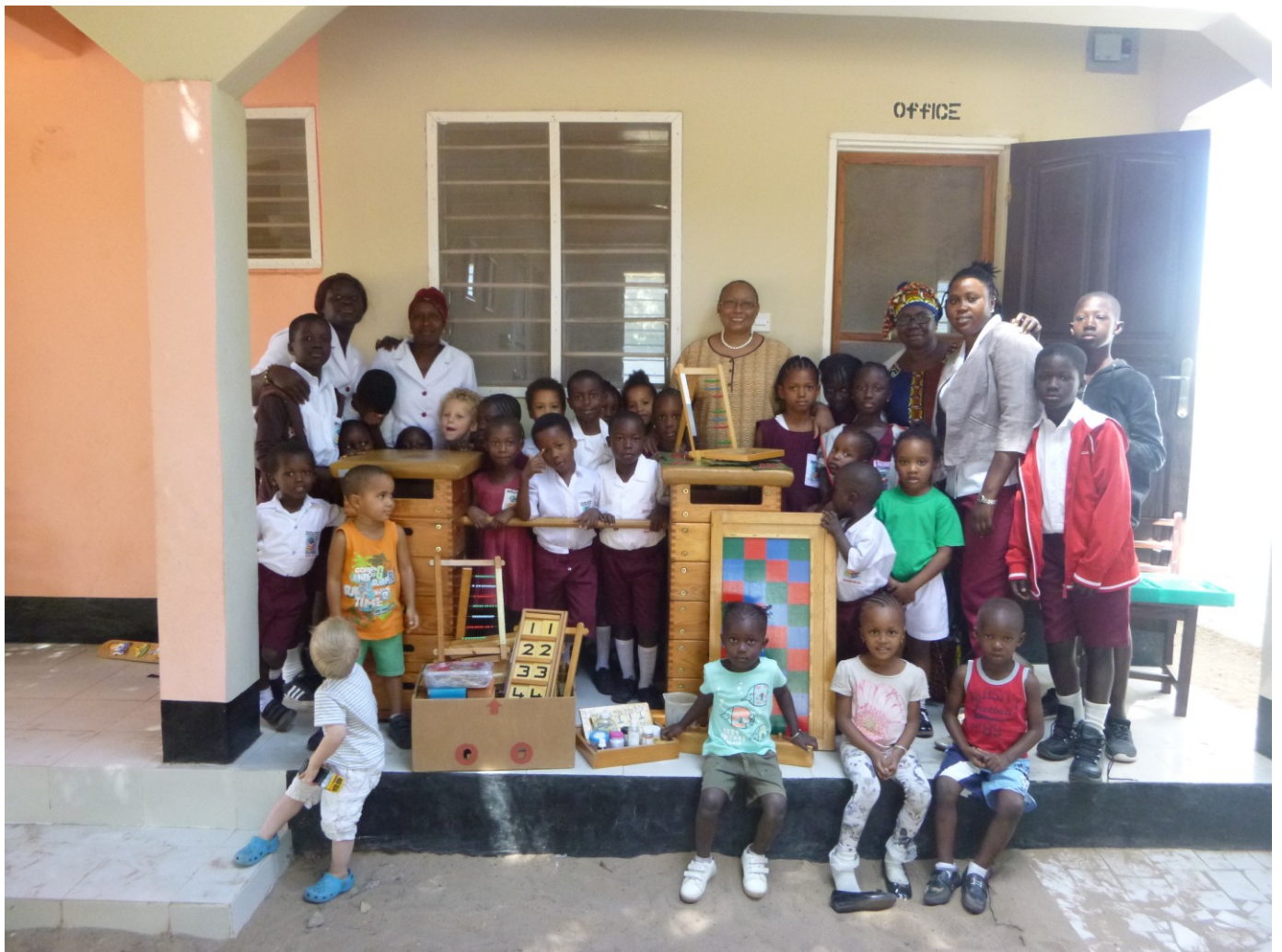
Januari 2017: overdracht van de materialen die verscheept zijn met de eerste container.