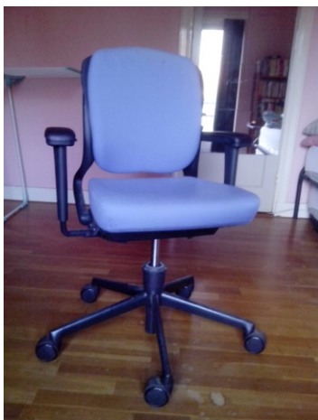
Materialen die nu verscheept worden. De verwachting is dat ze binnenkort aankomen in Gambia.